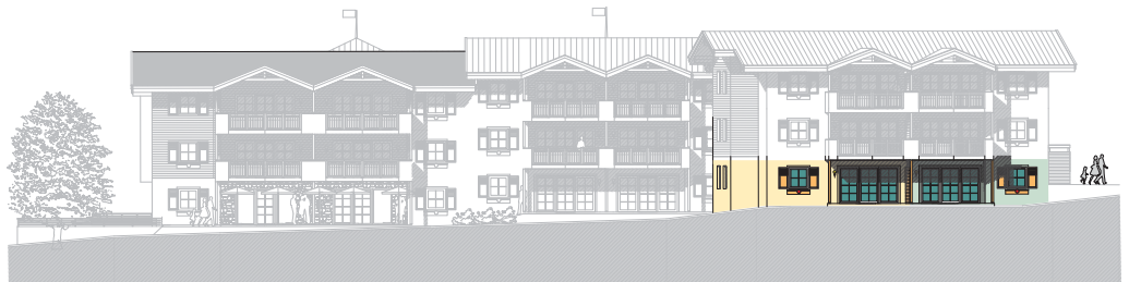
ANSICHT WEST, Bauteil B