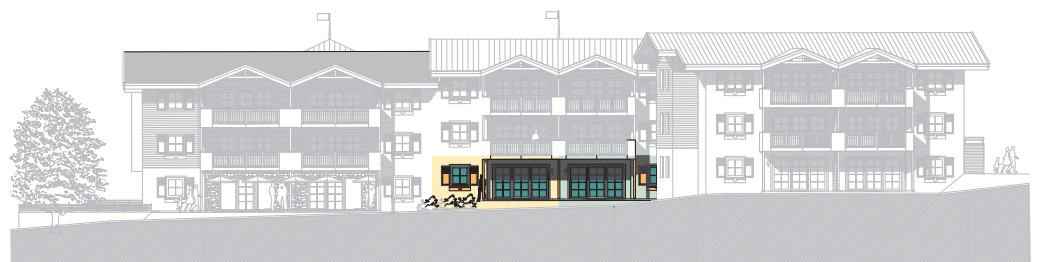
ANSICHT WEST, Bauteil B